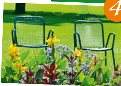
4 Stuhl sucht Paten: Ihr Platz für Erholung mit Ihrem Namensschild