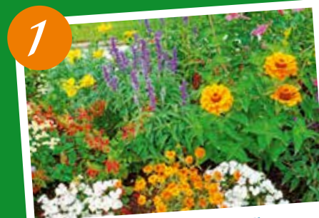
1 Von den „Insulanern“ liebevoll gepflegte Staudeninseln im Park

Noch mehr Projekte und Möglichkeiten zur Beteiligung