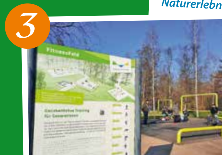
3 Fitness für alle auf dem LionsJump