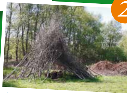
2 Naturerlebnisse für Kinder

Noch mehr Projekte und Möglichkeiten zur Beteiligung